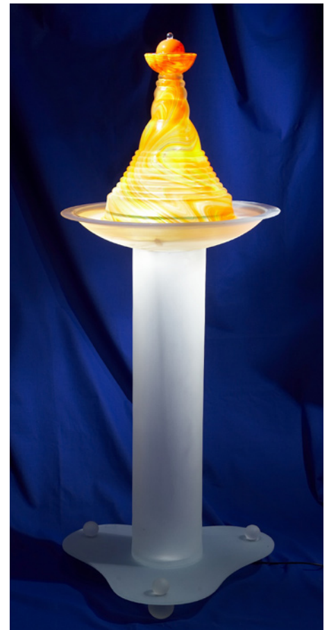
Brunnen „Madonna“ klein mit Schale: Schalendurchmesser ca. 30 cm, Gesamthöhe ca. 30 cm. Lieferumfang: Madonna inklusive | Kronenkugel, Pflegeanleitung (mit Pflegeset zur einfachen und natürlichen Reinigung), Zertifikat und Aufbauanleitung.